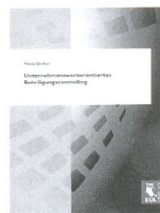
Dreher, Marco: Unternehmenswertorientiertes Beteiligungscontrolling

Tipp: Durch seine gute didaktische Aufbereitung der Materie ist das Buch einerseits als Lehrbuch geeignet und gibt auf der anderen Seite auch Praktikern einen umfassenden Leitfaden zu grundlegenden Bewertungsfragen an die Hand.