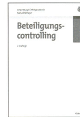
Burger, Anton/ Ulbrich, Philipp/ Ahlemeyer, Niels: Beteiligungscontrolling

Tipp: Der Leser erhält mit diesem Buch ein praxisnahes, mehr als 1.200 Seiten starkes Kompendium zu allen Themen rund um das Beteiligungscontrolling. Durch seine thematische Breite auf der einen Seite und die inhaltliche Tiefe auf der anderen Seite spricht es Fachexperten aus der Praxis sowie Studenten und Wissenschaftler gleichermaßen an.