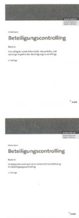
Littkemann, Jörn (Hrsg.): Beteiligungscontrolling

Tipp: Dieses Buch soll in erster Linie einen Beitrag zur wissenschaftlichen Literatur liefern, ist jedoch insbesondere aus methodischer Sicht auch für die praktische Anwendung von Interesse.