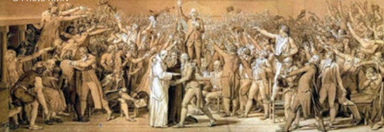
Le Serment du Jeu de paume – Jacques-Louis David, 1791