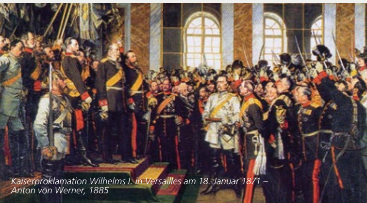
Kaiserproklamation Wilhelms I. in Versailles am 18. Januar 1871 – Anton von Werner, 1885

Fortsetzung des Symposiums „Constitutional Moments“