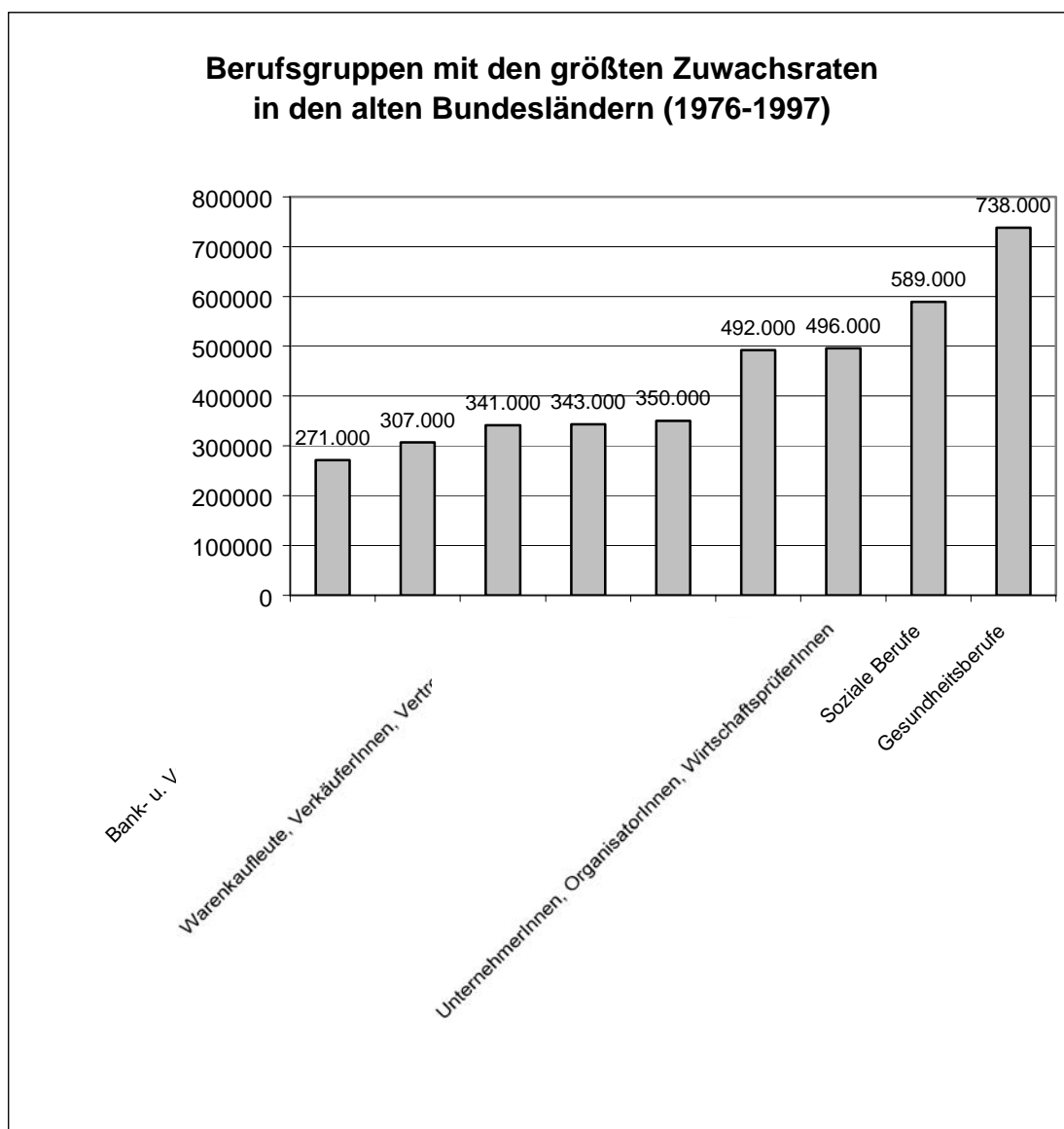
Abbildung 2: Eigene Darstellung nach Karsten et al. 1999 (nach Stat. BA versch. Jahrgänge, Rauschenbach 1999 und eigenen Berechnungen)

Wo entstehen nun neue Arbeitsplätze im Dienstleistungsbereich?