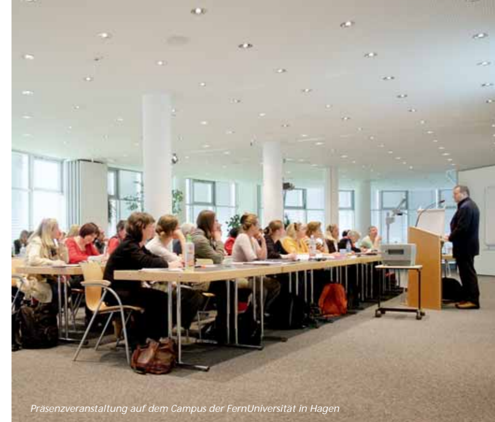
Präsenzveranstaltung auf dem Campus der FernUniversität in Hagen