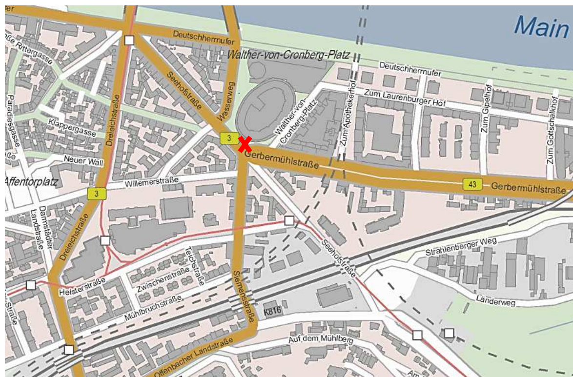
Umgebungskarte (© Bundesamt für Kartographie und Geodäsie, 2013)

Zu unseren Öffnungszeiten (Mo-Fr 16-19h, Sa 10-13h) erreichen Sie uns unter der 069-969324703. Taxis gibt es unter der 069-23001.