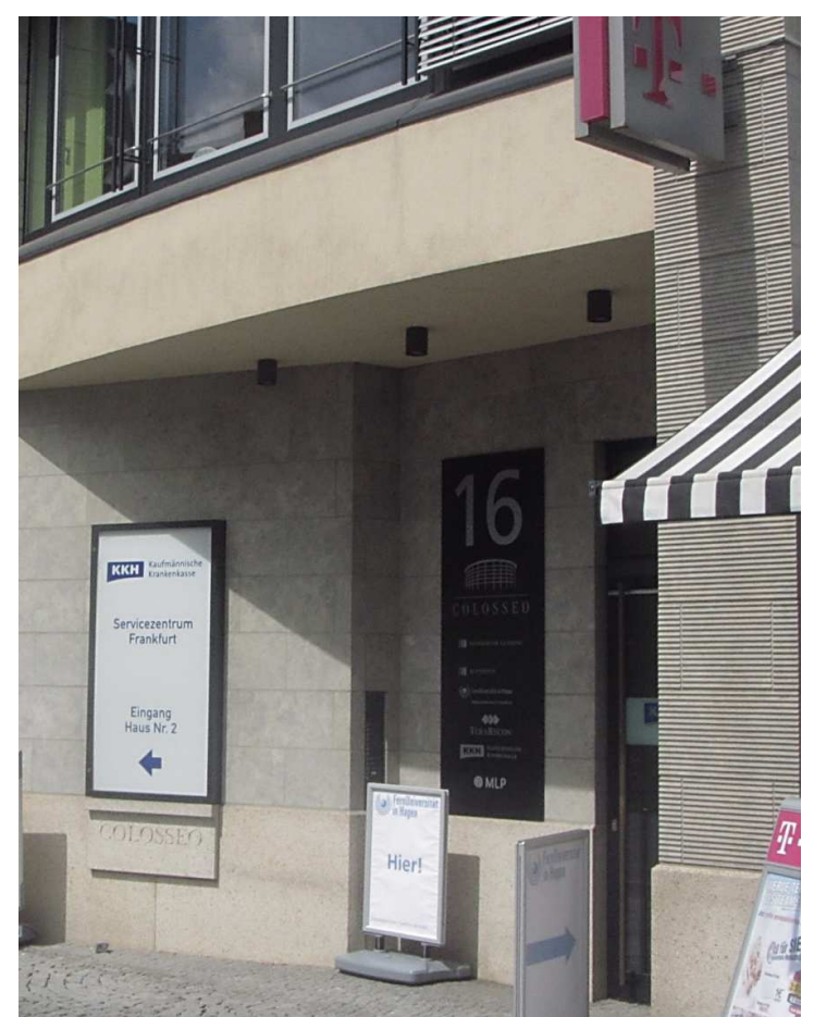
Unser Hauseingang. Über dem Aufsteller finden Sie die Türklingel.