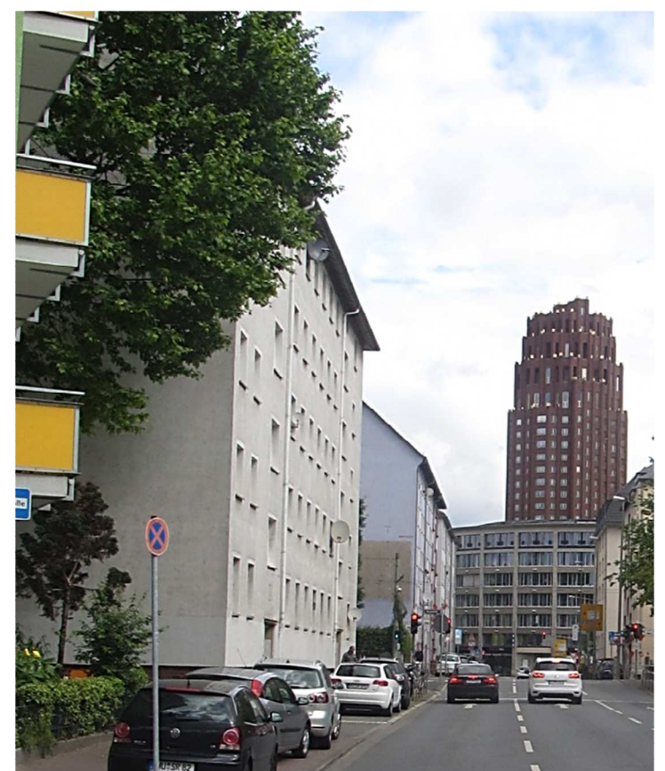
Blick vom Lokalbahnhof auf das Regionalzentrum.