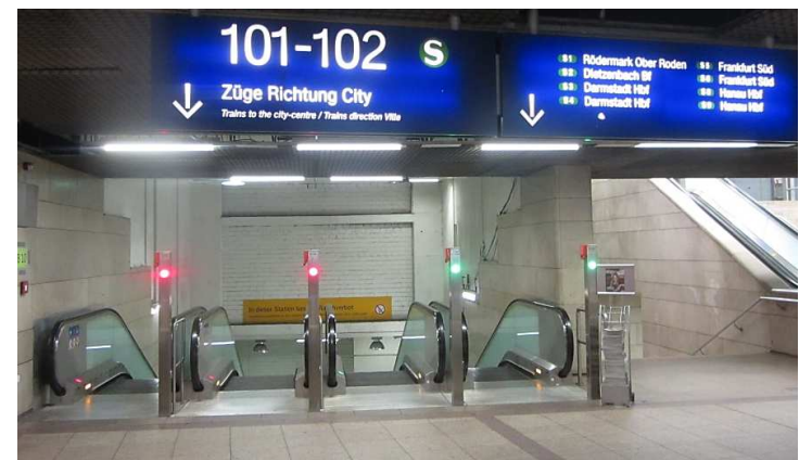
Ansicht am Hauptbahnhof, hier die Rolltreppen nehmen.