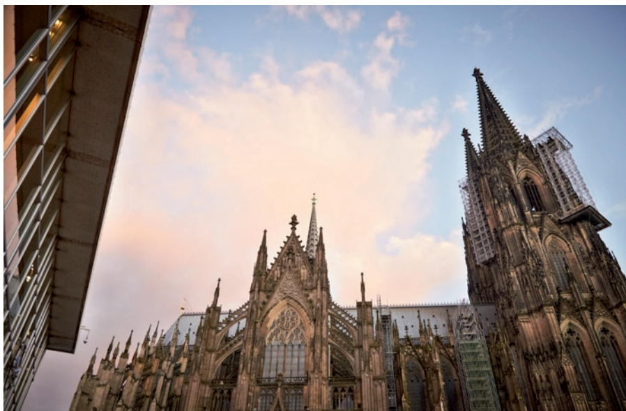
2013 findet die Summer School in Law in Köln statt.

Kaum ist die Summer School in Law 2012 vorbei, da laufen bereits die Vorbereitungen für das nächste Programm, das 2013 in Köln stattfinden wird. Damit steht auch im Sommer 2013 für Studierende des „Bachelor of Laws“-Studiengangs erneut die Summer School in Law als rechtswissenschaftliches Wahlmodul zur Verfügung. Weit über 100 deutsche, niederländische und spanische Studentinnen und Studenten haben seit der ersten Summer School in Law im Jahr 2008 bisher mit Unterstützung des DAAD an dem gemeinsamen Programm der FernUniversität, der Open-Universität der Niederlande und der UNED (Universidad Nacional de Educación a Distancia) teilgenommen.