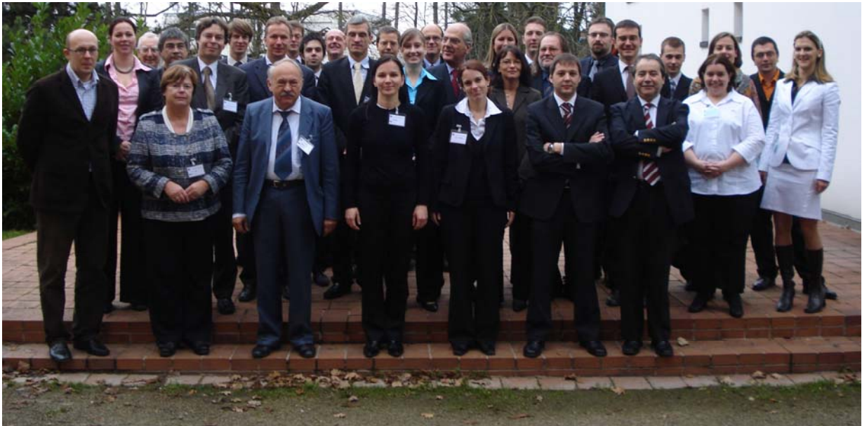
Teilnehmer aus ganz Europa bei der Konferenz des europäischen Netzwerks des Arbeitsrechts (European Labour Law Network, ELLN).

verwies auf die zentrale Bedeutung, die der Arbeitnehmerbegriff im Europäischen Arbeitsrecht besitzt. Dies sei Folge vermehrter Versuche von Arbeitgebern, größere Flexibilität in Arbeitsverträgen zu erreichen. Freedland hob hervor, die Arbeit der Studiengruppe sei ein äußerst wichtiger Beitrag zur Bestimmung des Arbeitnehmerbegriffs in Europa.