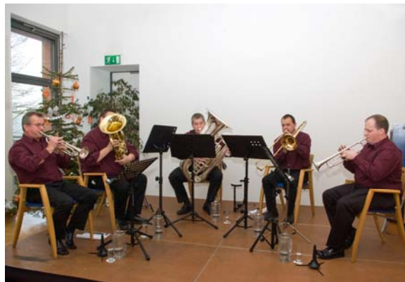
Das Blechbläserensemble „Bergisch Brass“

Als Leiter der Arbeitsgemeinschaft für die Ausbildung der Patentanwaltsbewerber in Nordrhein-Westfalen und Mitglied der Prüfungskommission für das Patentassessor-Examen konnte er viele wertvolle Erfahrungen in die Patentanwaltsausbildung an der FernUniversität einbringen. Er hat entsprechende Studienmaterialien für die Hagener