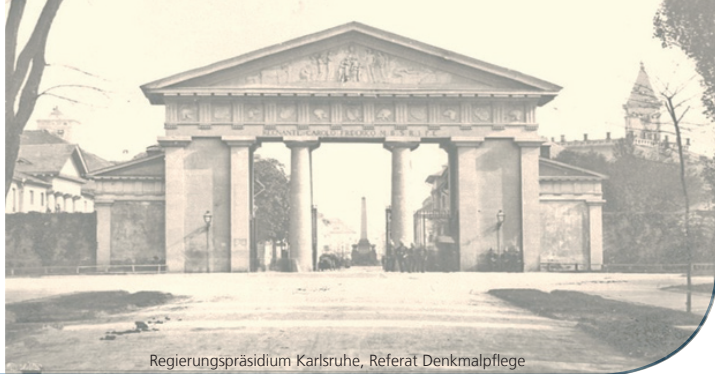
Regierungspräsidium Karlsruhe, Referat Denkmalpflege

Eine Veranstaltungsreihe am Ettlinger Tor. Der Eintritt ist frei.