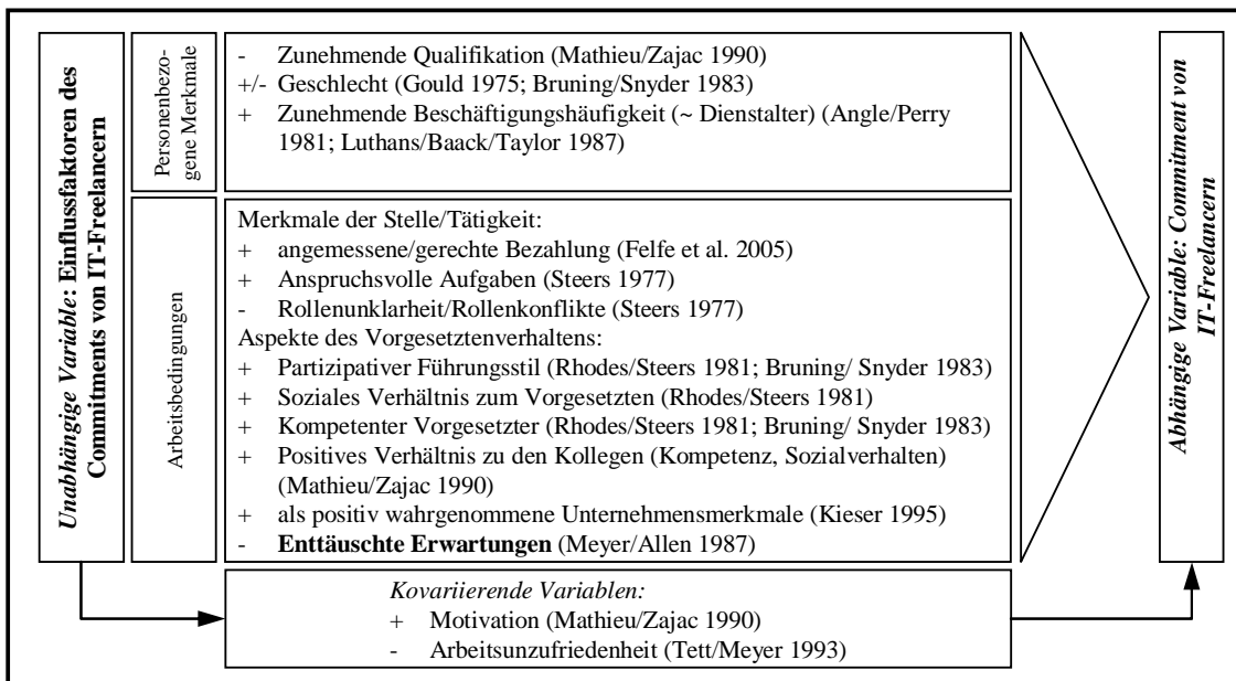
Abbildung 2: Forschungsdesign